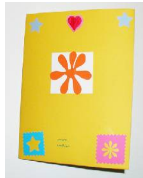
Exemples de cahiers faits main